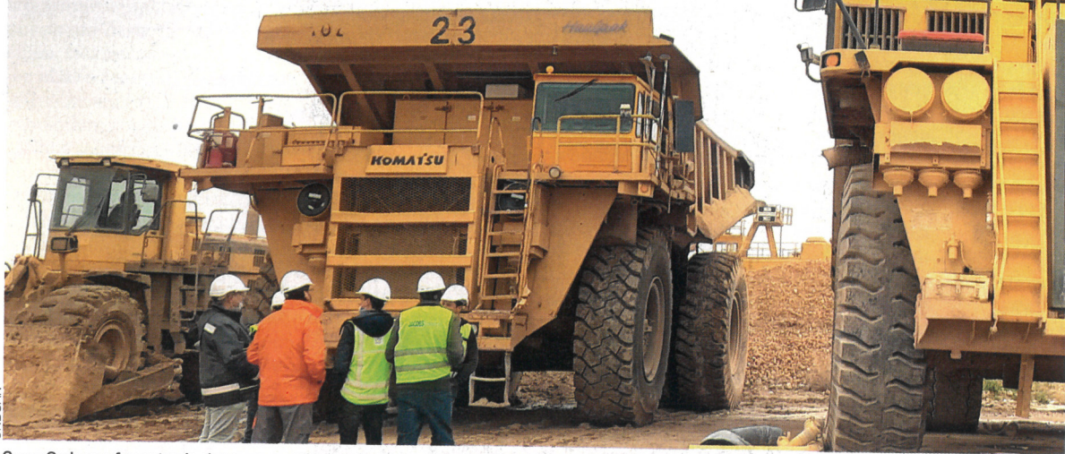
Grupo Ondoan reforzará todo el sistema contra incendios de las plantas de Office Chérifien des Phosphates- OCP.

La compañía celebra los 40 años de actividad empresarial con un macrocontrato con la química marroquí OCP Pág. 8 y 9